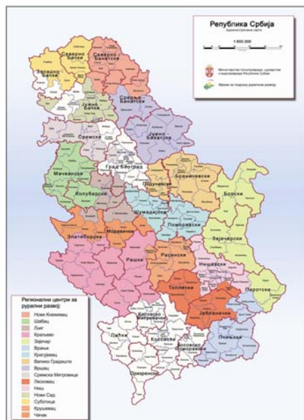
Слика 1. Мрежа руралних центара

Регионални центри за подршку руралном развоју успостављају подручне центре у општинама на територији коју покривају, координирају њихов рад и успостављају функционалну сарадњу између Министарства, центара за рурални развој, локалних самоуправа и потенцијалних развојних партнера; организују и спроводе обуку за подручне центре, рурално становништво и носиоце руралног развоја; редовно информишу јавност о активностима које спроводе регионални и подручни центри за рурални развој; и покрећу иницијативе за формирање локалних партнерстава.