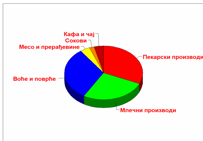
Слика: 1. Структура продаје производа органске пољопривреде у ЕУ Figure: 1. Structure of organic agriculture products sale in EU