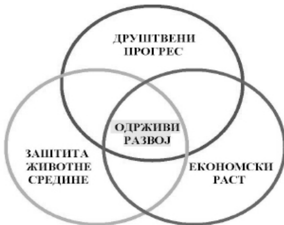
Слика 1. Концепт одрживог развоја у форми концентричних кругова (три стуба одрживости - економија, друштво и животна средина)